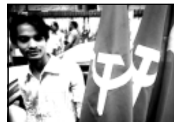
Рабочие-текстильщики на улицах Дакки

Репрессии властей не запугают рабочих-текстильщиков. Борьба будет продолжена!